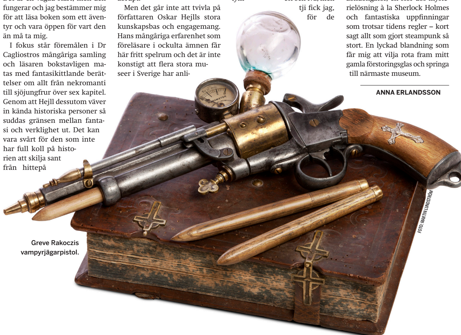
Greve Rakoczis vampyrjägarpistol.